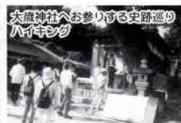
大森神社へお参りする史跡巡りハイキング