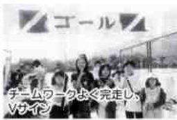
チームワークよく完走し、Vサイン