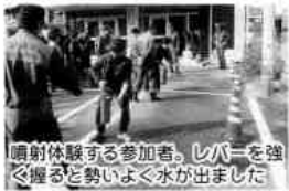
噴射体験する参加者。レバーを強く握ると勢いよく水が出ました