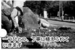
一つひとつ、丁寧に植えられていきます