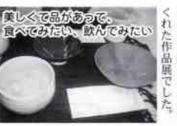
美しく品があつて、食べてみたい、飲んでみたい