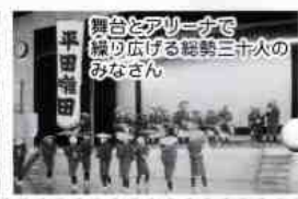
舞台とアリーナで繰り広げる総勢三十人のみなさん