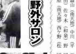
この色が出したいのよ

品を完成させました。昼食を頂きながら、所の車で展望台へ登り、瀬戸内海など三、六十度の眺望を堪能しました。その後、和室を預きながら、ビンゴゲームで盛り上がりました。行事が進行するにつれ和やかな