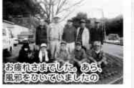
お疲れさまでした。あら、風邪をひいていましたの

太極拳生徒募集 あなたちも太極拳を始めよう 年輪、男女は問いませ 学におこしください。 連絡先 大井(二一七)一八