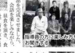
指導員の方々に楽しみ方をお聞きする

十月二十九日(日)由宇の山口県ふれあいパークで、平田ふれあい野外サロンを行いました。参加者は、招待者十一名、福祉部員等二十四名でした。 到着後、記念撮影を行い、その後、陶芸(絵付け)と、七宝焼きに分かれ、所の指導員に指導頂きながら、熱心に楽しもうと制作され