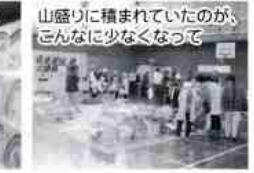
山盛りに積まれていたのが、こんなに少なくなつて

かな雰囲気になり、新しい友を見つけた方もあつたようです。好天に恵まれ、事故もなく、皆さんの満足そうな顔を拝見しながら、平田に帰る事ができました。(河本静恵)