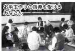
お手玉作りの指導を受けるみなさん