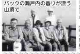
バックの瀬戸内の香りが漂う山頂で

かな雰囲気になり、新しい友を見つけた方もあつたようです。好天に恵まれ、事故もなく、皆さんの満足そうな顔を拝見しながら、平田に帰る事ができました。(河本静恵)