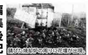
錆びた焼却炉の周りに花壇が出現。

親子鶴睦むを一人立ちて見る 手を添えてやりたき声に残る虫 初霜や縁に取り込む先いづくつ 蓮根振り声かけ行くも揮りぬ 残る虫身を葉に合ふ老夫夫婦 年々に訪う栗鴉の来し使便り 鶴渡り一年振りの帰還の 残る虫石灯籠の灯明りに まぼろしとなりし鉄路や残る虫 里人の熱き思ひに鶴渡る 弥生女