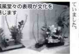
威風堂々の表現が文化を感じます