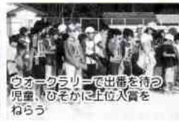
ウォークラリーで出番を待つ児童、のそがに上位入賞をねらう