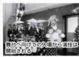
舞台へ向けての入場から演技は開始される

一、行事の実績 昔から百年に三回と定められ、およそ三十年毎に挙行されてきた。例外もあつたようである。皇太子殿下に慶事があった際は行われ、文政六年、安政四年(文政から三十四年目)、慶応元年(安政から八年目)、明治十一年(慶応から十四年目)と次々に行われた記録が残っている。明治十一年五月二十三日、平田検校(一)御式