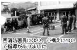
消防防犯団第六部により、心構えについて指導がありました

十一月十日(木)平田地区において、「家庭用消火器の噴射体験」が行われました。 秋の全国火災予防週間にちなみ、岩国市消防組合西消防署、消防防犯団第六部の主催で、二十名の方が熱心に参加しました。 消防防犯団第六部の部長は、「体験が勇気と自信をもたらす」とこの企画の意義を強調していました。