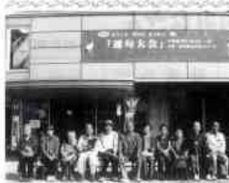
参加記念に、まず一枚をパチリ

戸内海など三、六十度の眺望を堪能しました。その後、和室を預きながら、ビンゴゲームで盛り上がりました。行事が進行するにつれ和やかな