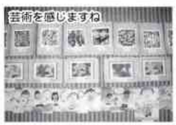
芸術を感じますね