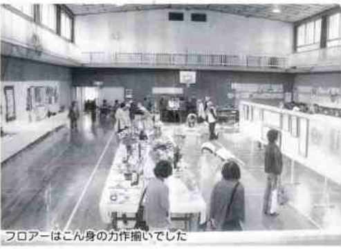
フロアーはこん身の力作揃いでした

第二十四回平田地区作品展が十一月十一日(土)、十二日(日)の二日間、平田住民ホールで開催されました。今年は一会場が手狭いとの反省から、平田供用会館の学習室を追加しての展覧となり、多数の方が来場しました。園児、児童、生徒、一般を含めて、四百五十八名、五百五十七