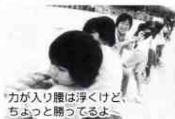
力が入り腹は浮くけど、ちよつと勝ってるよ