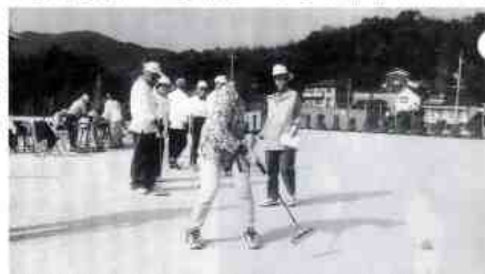
上位進出をねらうこの一打、ナイスショットでした。