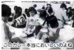
このカレー本当においしいのよ