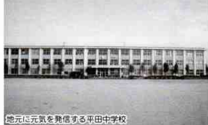
地元へ元気を発信する平田中学校

毎月一回発行されている。平田の名前を県下全域に知らしめる。先にあげたソフトテニス、柔道に限らず、他分野でも優秀な活躍がみられます。もちろん、文化祭や、上位入賞がみられる。これらの活躍は地域活性化の起爆剤になります。児童には向上心、壮年者には湧き立つ情熱、高齢者には元気の出る源を与えます。これからは健康を促進し、好成績を期待してまいります。応援してください。