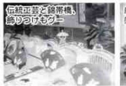
伝統立巻と錦帯橋、飾りつけもクワイ